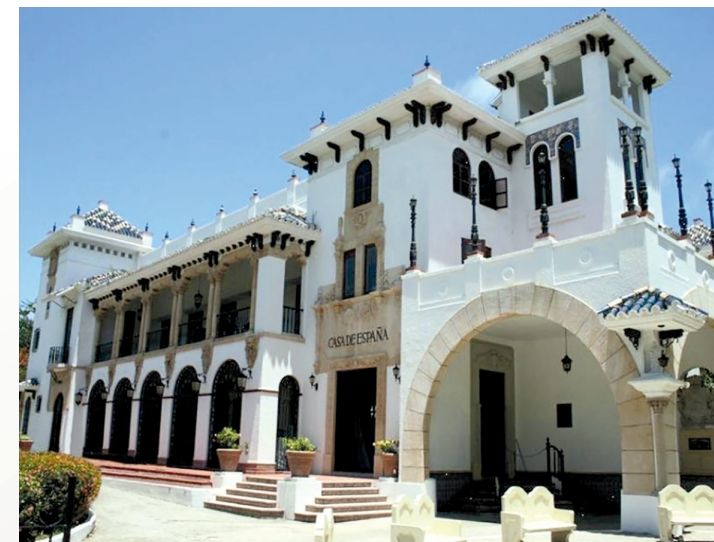
Exterior de la Casa de España en San Juan, Puerto Rico.

El Comité de Honor del I Congreso Hispanoamericano estuvo integrado por los Presidentes de todas las Comunidades Autónomas, excepto el del País Vasco, que declinó la invitación. El Comité Ejecutivo estuvo formado por doce personas, algunas de ellas representativas de cuatro ministerios, y los representantes de las Casas Regionales. Lo presidí, en mi condición de Presidente de la Federación de Casas Regionales y Provinciales de España.