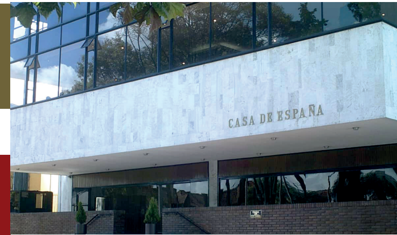
Casa de España en Bogotá.