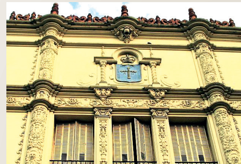
Centro Asturiano de Buenos Aires.

Para la preparación y la proyección del Congreso Hispanoamericano visité la mayoría de las Comunidades Autónomas, y realicé dos amplios viajes a América. El primero, del 7 al 27 de julio de 1984, visitando los más importantes centros en Argentina: Buenos Aires, Rosario, Mendoza y Córdoba; en Brasil: Sao Paulo, Río de Janeiro, y Salvador/Bahía; en Paraguay, Asunción; y en Chile, Santiago de Chile. En el realizado del 26 de septiembre al 13 de octubre, estuve en: Canadá, Montreal; Estados Unidos: Nueva York y Miami; y las capitales de Colombia y Venezuela, Bogotá y Caracas. Un breve resumen nos proporciona los siguientes