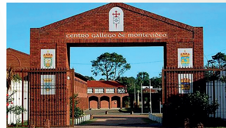
Centro Gallego de Montevideo.

La composición del Comité de Honor del Congreso nos permitió “comprometer” a 30 personalidades españolas de primera magnitud. Cuatro Ministros del Gobierno nos remitieron sendos alentadores mensajes, que en el fondo suponían otros tantos compromisos.