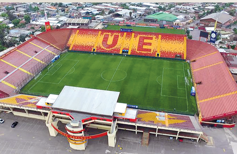
Estadio Santa Laura de la Unión Española de Santiago de Chile.

“Esta voluntad asociativa ha dado origen, actualmente, hay 2.135 Casas Regionales y Centros Españoles, repartidos en los cinco continentes, que constituyen una red de Centros y servicios a los españoles en ellos agrupados y que debe ser debidamente reconocida y apoyada por el Estado como formas de participación y cooperación social a que los españoles tienen derecho”.