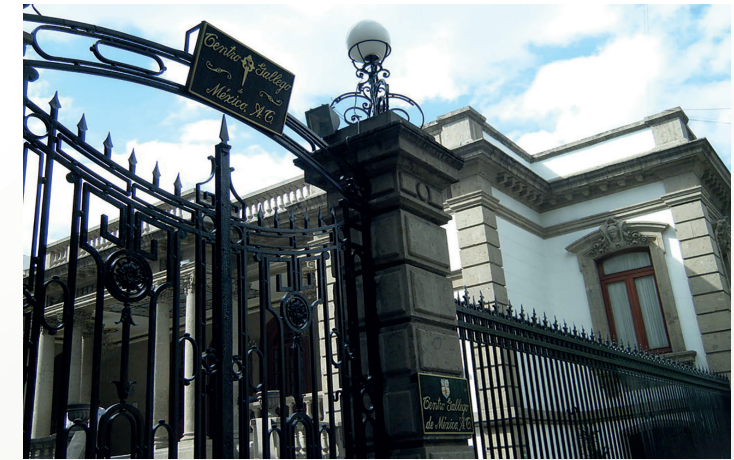
Centro Gallego de México.

datos: 15 sesiones de trabajo con la asistencia de alrededor de 400 directivos, la visita a 44 centros importantes, reuniones con nuestros Embajadores y Cónsules Generales de los citados países,... Además, cabe destacar las reuniones con los Alcaldes de destacadas ciudades como: Bogotá, Buenos Aires, Caracas, México DF, Miami, Montreal, Nueva York, Santiago de Chile,... junto a ruedas de prensa.