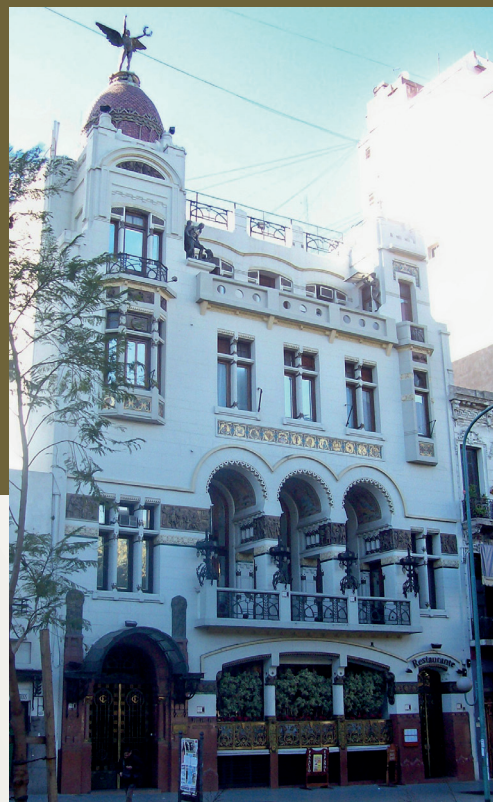
Club Español de Buenos Aires, 1852.